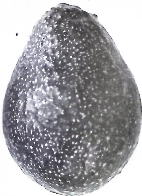
פרי הזן 'יוליה' (N526)