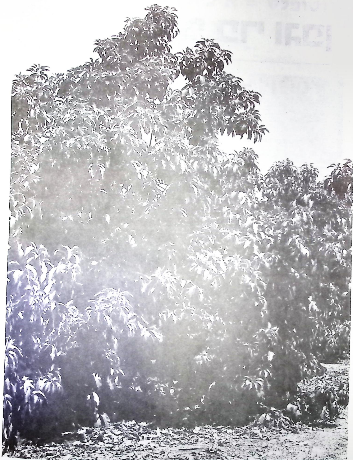
"יוליה" עץ צעיר. מטע בין דגן