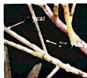
שקד בר "ערבי"