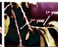
שקד תרבותי "אום-אל-סאחם"