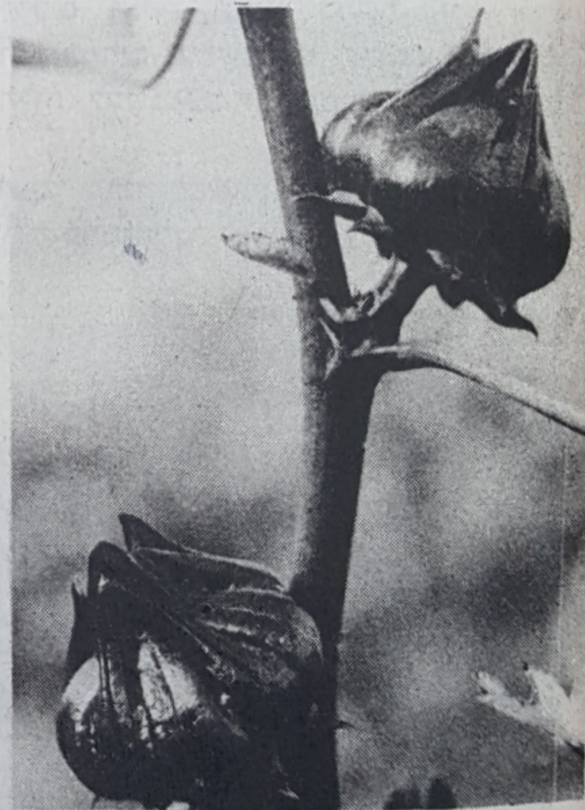
תמונה 1. הלקט (פרי) בוגר של היביסקוס עבה-הגביע. שים לב לברק שטח פני הפרי ולקצוות המחודדים של החפים.

הלקט יפה צריך להיות בעל קוטר 2.5 – 3.5 ס"מ, החפים צריכים להיות בעלי צבע אדום ארגמני עז, בשרניים ומחודדים בקצור-תיהם. ההלקט חייב להיות חלק לגמרי בשכבתו החיצונית; כלומר, הוא צריך להיות נקי מפגיעות מכניות, ללא נקרוזות, נקודות לחץ ועקבות אכילה של ציפרים או תול-עים. כן הוא חייב להיות פטור ממחלות ונקי מאבק, ממשקעי ריסוסים או ממשקעי השקית המטרה. הברק הטבעי של שעוות ההלקט צריך להיראות: תמונה 1 מציגה הלקט בעל צורה רצויה.