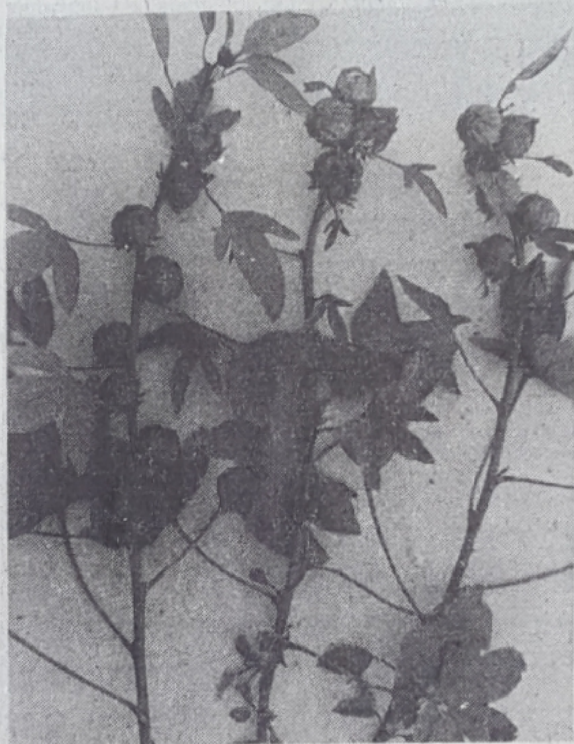
תמונה 2. ענפי פרי על עלוותם.