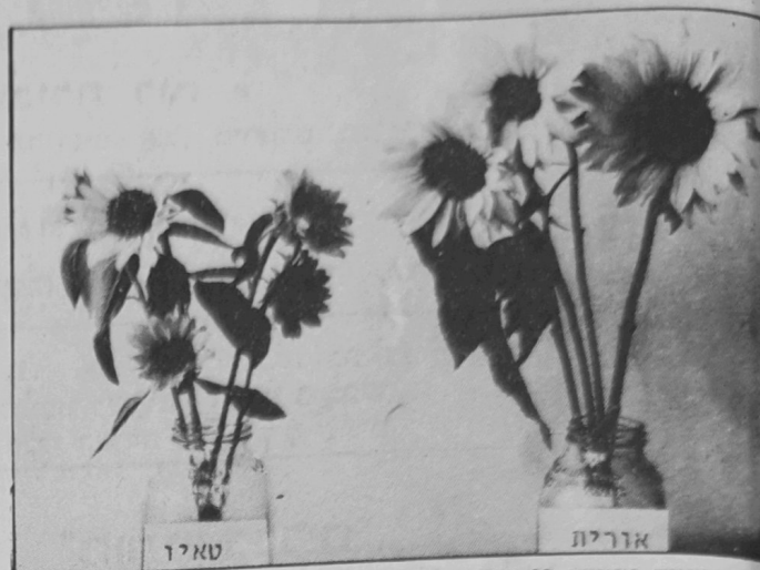
מרחי חמניות ממזרע 17.11.82 ברחובות. גבעולי הזן אורית קוצרו ב־30 ס"מ לפחות, ואילו גבעולי הזן טאיו הם בארכם המלא. שים לב גם להפרש בגודל הפרחים.