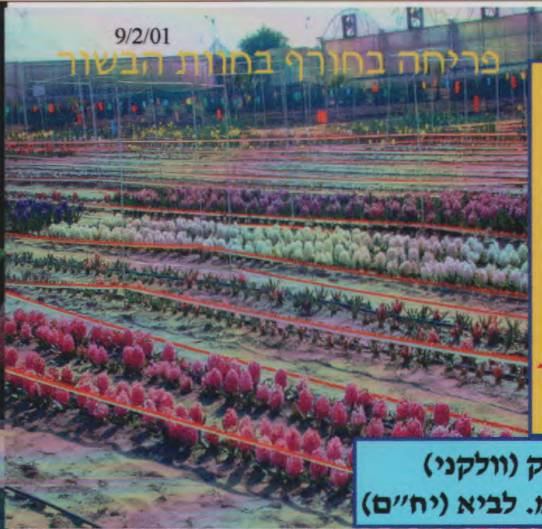
בצל יקינטון מישראל פורח באוקטובר באנגליה