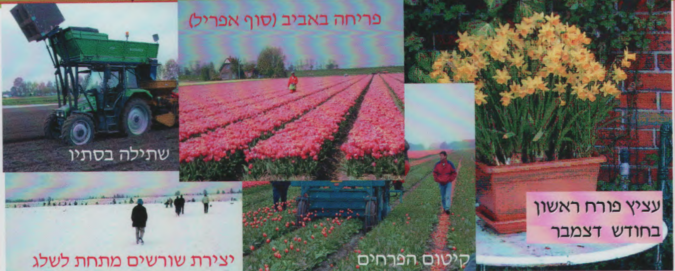
פריחה באביב (סוף אפריל)