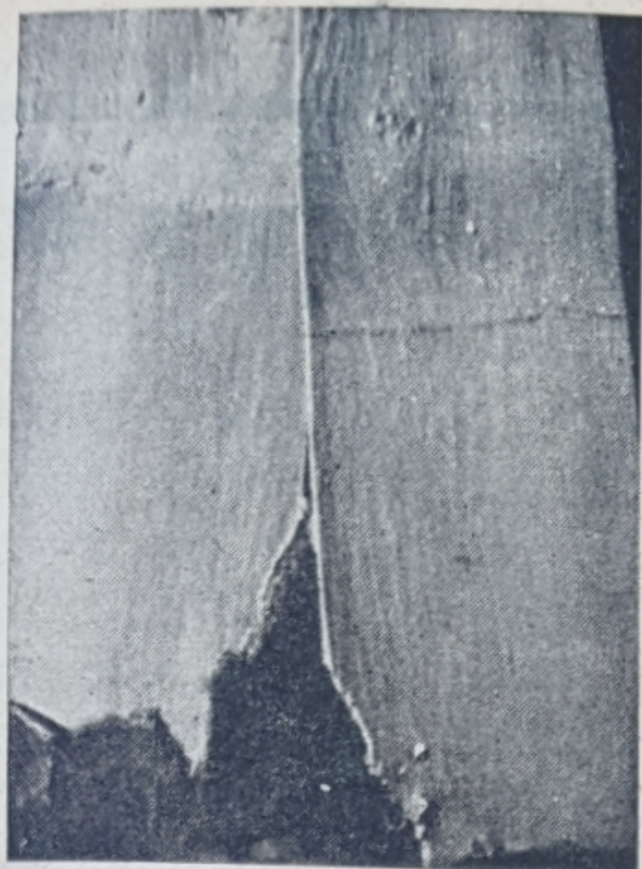
תמונה 8. שמוטי על ת"ז ואלדון נגוע בניקרון העצה.

משמאל: לאחר הרחקת הקליפה, נראים חריצים ונקרים קלים בעצת הכנה והרכב; מימין: בצידה הפנימי של הקליפה שהוסרה רואים את הבליטות המתאימות לנקרים וחריצים בעצה.