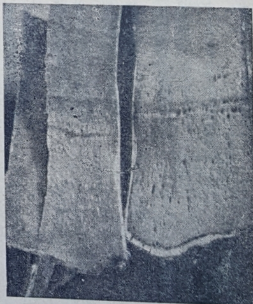
תמונה 7. שמוטי על אשכולות דונקן, נגוע בניקרון-העצה.

הלימון החמוץ. שמוטי הורכב על לימון חמוץ, שהובא מרחובות. בשנים 1938—1943 היו יכולים די טובים — כ-89% מיבול השמוטי שהורכב על החושחש. אבל בארבע השנים שלאחר כך חלה הפחתה פתאומית עד כדי 37%, והפחתה זו נמשכה עד לשנת 1952. בשנה זו היה היבול בממוצע לעץ כ-9% בלבד, בהשוואה למורכב על החושחש. בבדיקות נקבעה התנוונות מחריפה והולכת, יובש רב בנוף, ונראה ניקרון-העצה בכנות של שלושה עצים ובשני רוכבים; בעצה של רוכב אחד נראה הניקרון ההפוך. האשכוליות. השמוטי הורכב על שני זני אשכול-ליות — על אשכולית "דונקן" ו"מק-קרטי". ניטעו שישה עצים מכל זן. לאחר שנעקרו מכל זן שלושה עצים, מחמת ה"עלעלת", נותרו לכל זן שלושה עצים. העצים שנותרו התפתחו באופן שונה. אלה שהורכבו על כנת מק-קרטי פיתחו נוף גדול וענף, לעומת הנוף הבינוני של העצים על כנת ה"דונקן". במשך עשר השנים הראשונות לנטיעה, שווים היו, פחות או יותר, יבולי השמוטי על שתי הכנות האלו, אולם בשנים שלאחר כך פחתו והלכו יבולי השמוטי על "דונקן", ואילו יבולי השמוטי על מק-קרטי נשארו על רמתם. בבדיקת הכנות מצאו, כי שתי כנות מבין השלוש, בכל זן, נגועות בניקרון-העצה. אחד הרוכבים על כנת הדונקן נפגע גם כן בניקרון. בכנת הדונקן נראו חריצים וכן ברוכב שלו. בכנת המק-