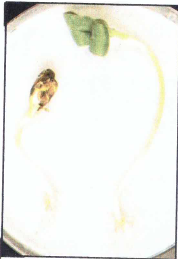
נבטים בני 7 ימים. נבט בריא (ימין) לעומת נבט בעל פסיגים לכודים בתוך הפריקארפ (הפריקארפ חוסר). שים לב להאטה בהתפתחות הנבט הנגוע.