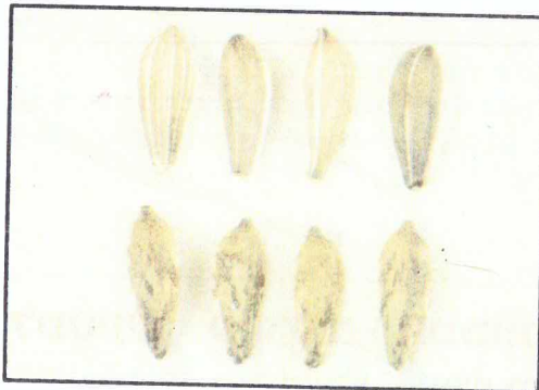
זרעונים בעלי כתמים בפריקארפ, לעומת זרעונים ללא פגיעה.