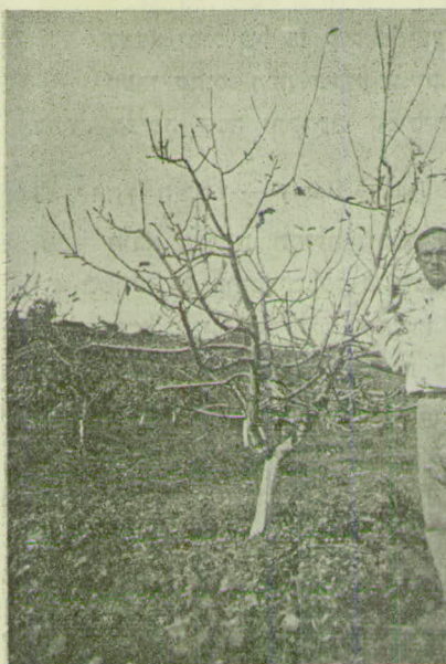
תמונה 2א' עץ תפוח מהזן „מיניסטר פוןהמרשטין“ Minister von Hammerstein