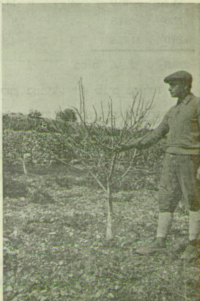
תמונה 7. „המורה“ Schoolmaster