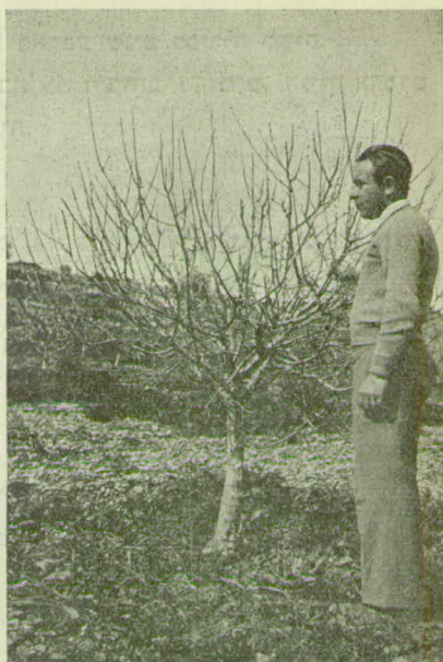
תמונה 2. עץ תפוח מהזן „בִּידוּיס“ Ben Davis