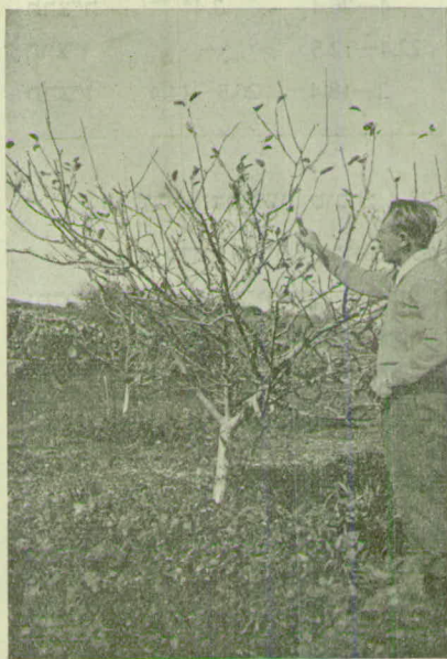
תמונה 8. „עכבית“ Grosseillier