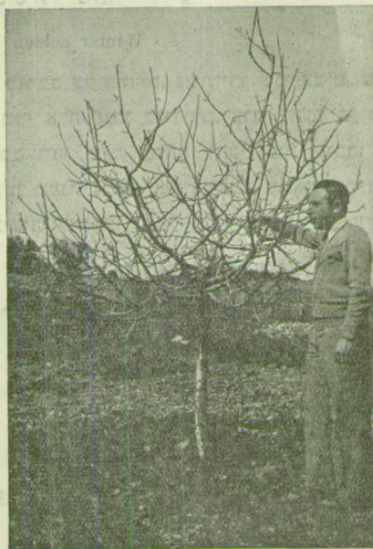
מלכת לנדסברג "Reinette de Landsberg"

התנובה הממוצעת לעץ 10.7 ק"ג בפירות לשוק. העצים הפרי כדורי פחוס; הרוחב 67 מ"מ והגובה 50 מ"מ, הפה שקוע קצת. הגוון ירוק-מאדים, ריחני. הציפה רכה, צהבהבת, מתוקה יינית, טעימה וריחנית.