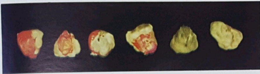
זרעי תירס נגעים בפניציליום למאמר "חיטוי זרעי תירס מהזן גיבילי"

משמאל — גדלים שונים של פרי רולט, כולם ראויים לאכילה למאמר "רולט, גידול חדש בארץ"